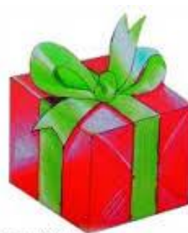
Niečo sa chystá

Ak láska topí ľad čo pani Zima vyčarila, ak dá človek viac čo v sebe skrýva, ak vládne všade ticho a počuť len praskať mráz, padajúce vločky a v detských očiach je vidieť jas. Tak prišla doba, keď každý pre každého má pár prívetivých viet, pre ten zázrak Vianoce a nad čaro Vianoc nič krajšieho niet!