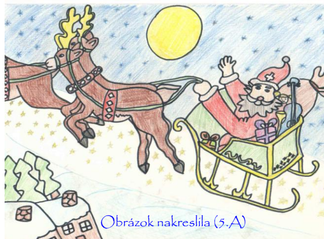
Obrázok nakreslila (5.A)

Vianoce v Kanade bývajú zasnežené a poriadne mrazivé. Na každom kroku nájdete rozsvietené vianočné stromčeky a vianočné dekorácie. Obchody sú preplnené ľuďmi. Darčeky nosí Santa Claus, ktorý lieta na saniach, ktoré ťahá osem sobov. Kto chce nejaký darček dostať, musí na kozub alebo na okno zavesiť pančuchu. Vianočná nádielka darčekom sa koná ráno, 25.-teho decembra.